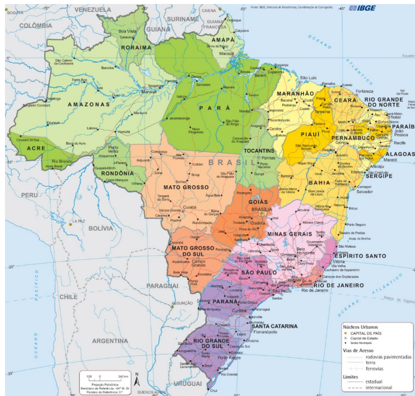
IMAGEM 1: Mapa político do Brasil

A imagem deve ser incluída no corpo do texto, sempre centralizada e seguida de uma legenda explicativa, que também indica a fonte / autoria, com fonte Times New Roman, corpo 11, segundo o exemplo: